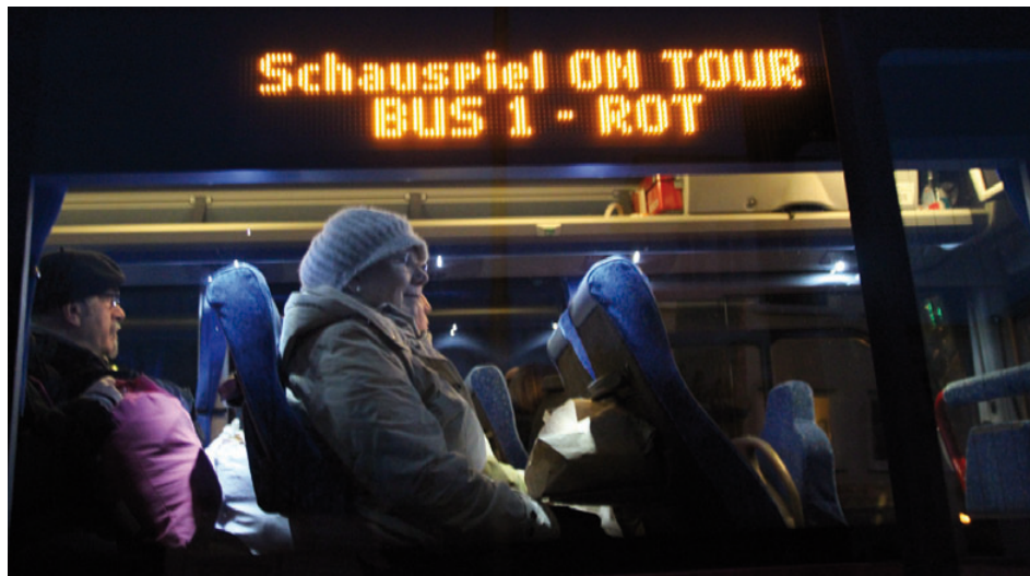
Besucherinnen und Besucher auf ›theatralen Gang‹ durch Wuppertal